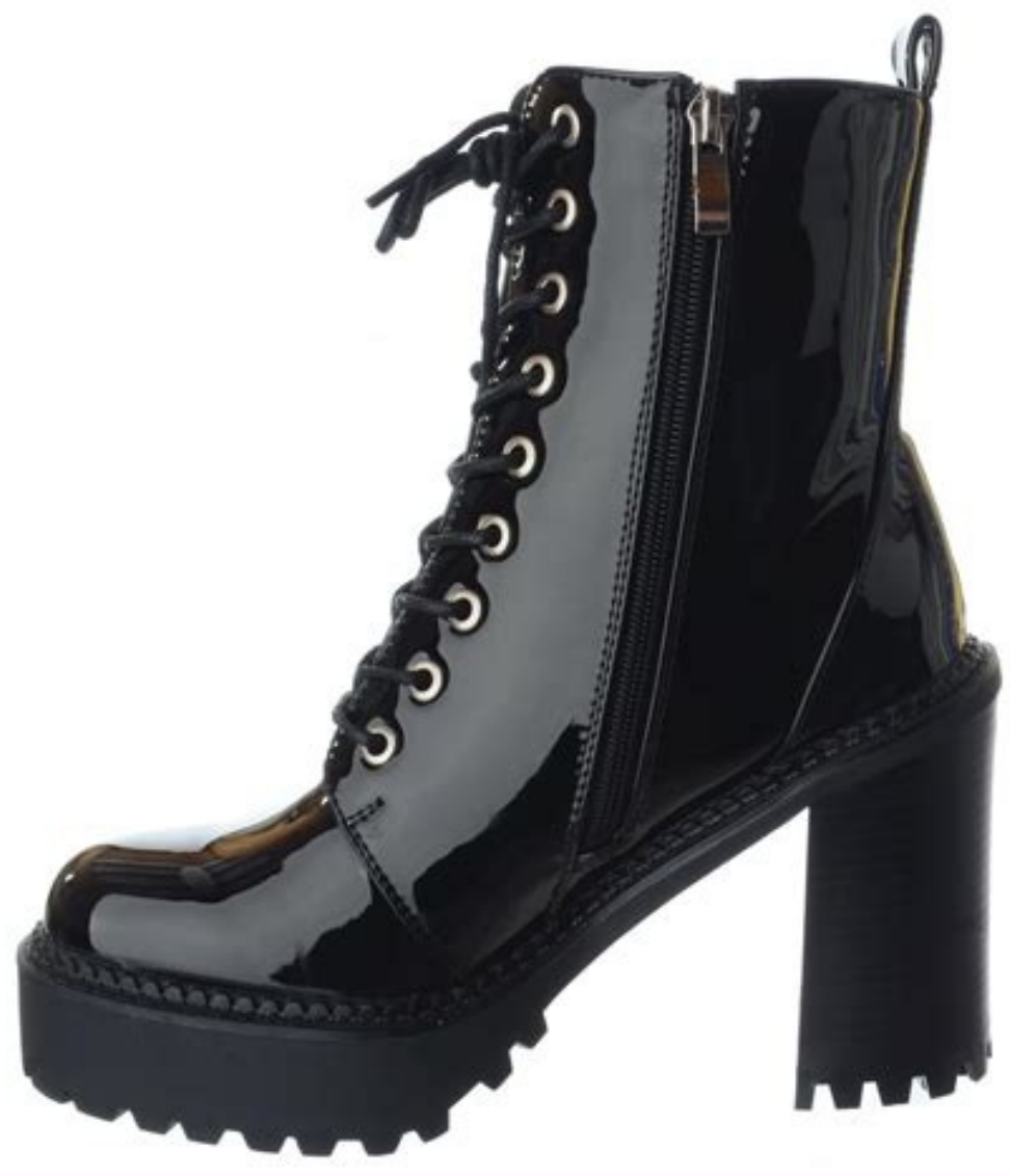
Chunky platform ankle boot